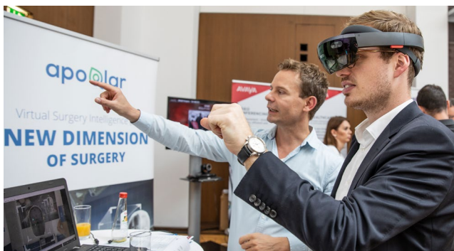
Neue Entwicklungen der Aussteller ziehen die Besucher in ihren Bann

Mediziner, Fachleute aus Unternehmen, Wissenschaftler, Praktiker und Politiker diskutieren über aktuelle Entwicklungen der digitalen Medizin und die sich daraus ergebenden Anwendungen und Neuerungen. Seien Sie dabei und erleben Sie innovative Projekte aus der Praxis, technische Entwicklungen und spannende Diskussionen. Start-ups können bei einem „Match-Making“ bereits vor dem Kongress Termine mit potenziellen Partnern für den Kongresstag im Innovationsforum IHK Hessen innovativ vereinbaren.