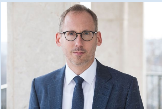
Kai Klose, Hessischer Minister für Soziales und Integration