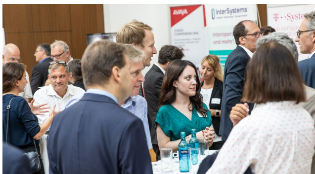
Regel Kontakt zwischen Ausstellern und Kongressbesuchern während der Pausen